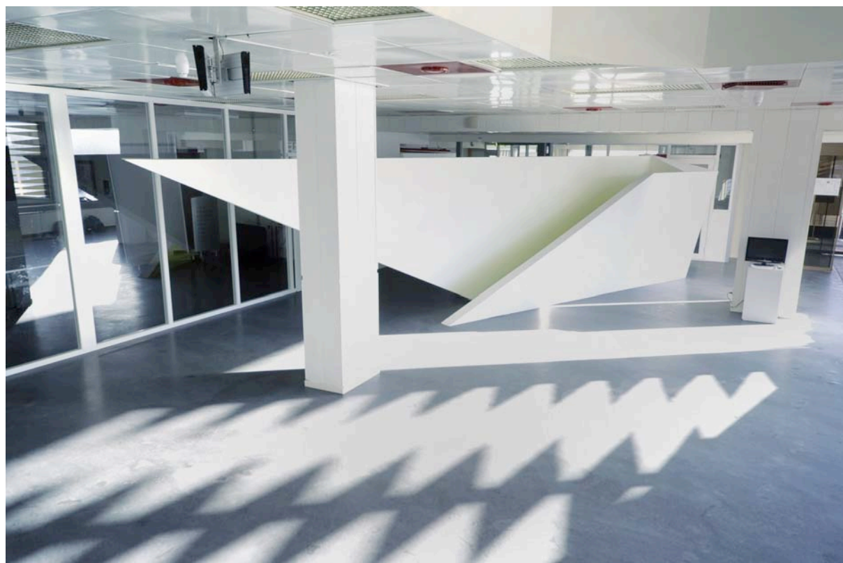
Anders Sietvold Moe: Untitled (passage for reflection) , 2011. // Vadsø kunstforening. Fra prosjektet Uten ramme: Nye rom, 2010 – 2011. Produsert av SKINN i samarbeid med Tromsø kunstforening. // Foto: Sonja Sitala

Det er den enkelte fylkeskommunes ansvar å vurdere hva slags stipendordninger de eventuelt ønsker å ha, samt å utvikle disse.