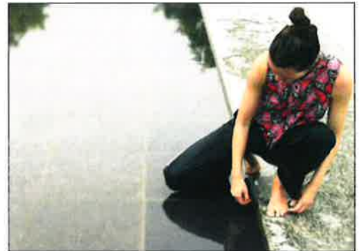
DANS: Kunstvandringen ender opp ved Vannspeilet utenfor Bodø Domkirke der den offisielle åpningen finner sted.